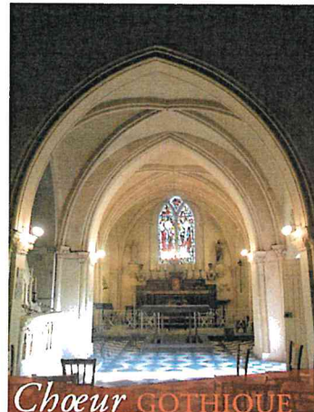
Choeur GOTHIQUE du XIV e siècle

Built on the former Roman way linking Falaise with Vieux, the church is an age-old place of worship. The nave was rebuilt after the French Revolution, in the same style as the original 14th century Gothic choir. The clock tower dates from 1850. Inside, the modern stained glass windows created in 1950 by Vosch replaced those destroyed in 1944. In the nave, a statue depicts Saint Michael pushing Satan into the abyss.